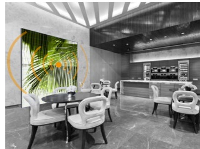
Klang und Kunst – überall dort, wo man sich begegnet