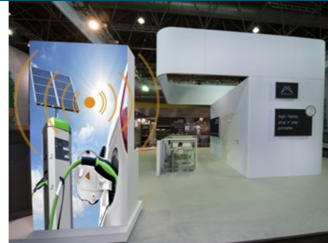
Diskrete Klänge und akustische Informationen am Messestand