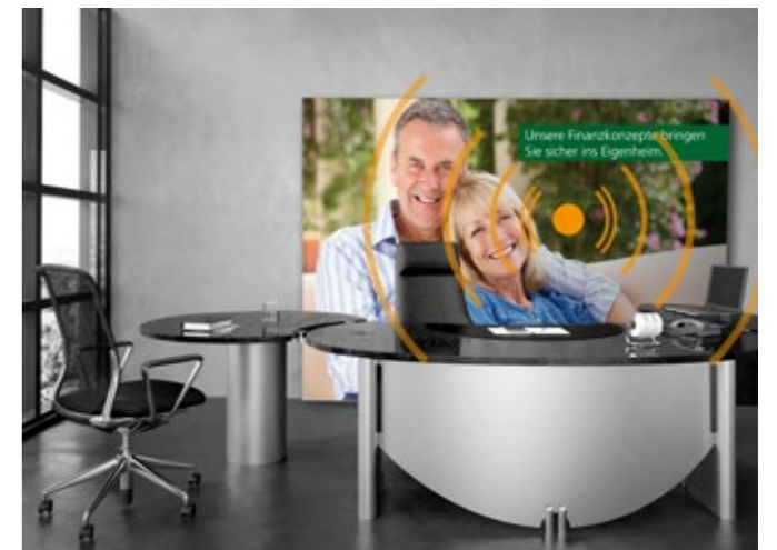
Einzigartige Akzente setzen am Arbeitsplatz